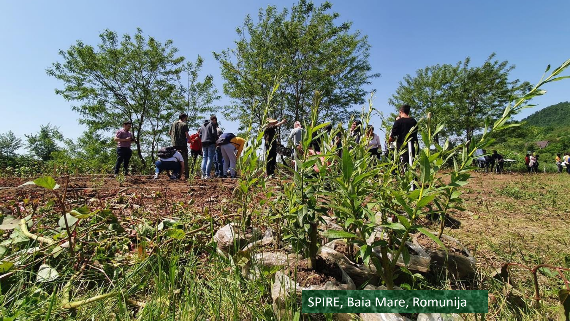
SPIRE, Baia Mare, Romunija