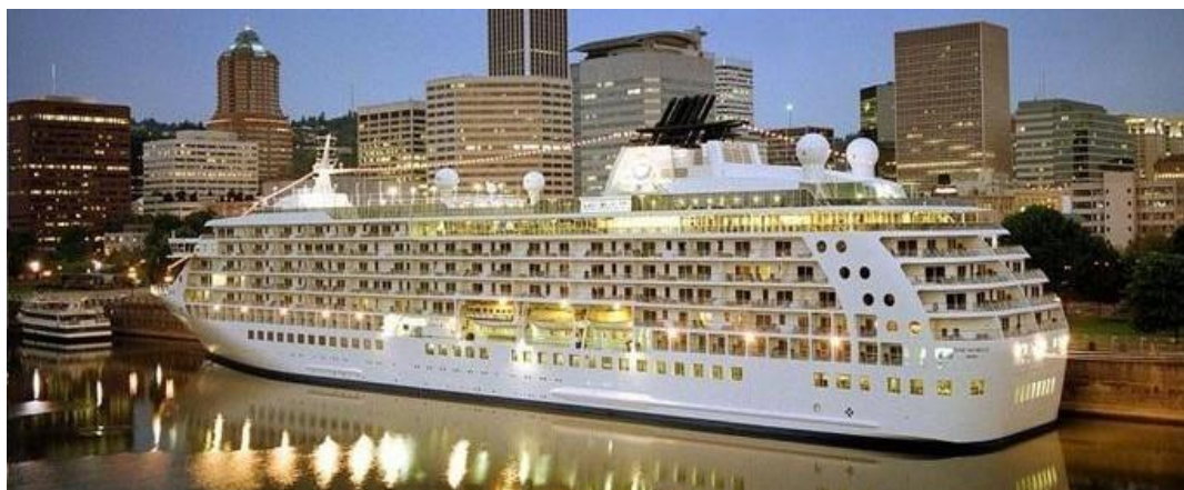
Križarka v Dublinskem pristanišču

James Joyce ne bi verjel svojim očem: v dublinskem pristanišču, ki ga večkrat omenja v svojih knjigah, vsak teden pristajajo ogromne križarke, dolžine treh nogometnih igrišč, iz njih pa se na mestne ulice izkrca več kot 100.000 turistov na leto. Ti tuji obiskovalci vpijajo znamenito literarno vzdušje – in v trgovinah porabijo milijone evrov.