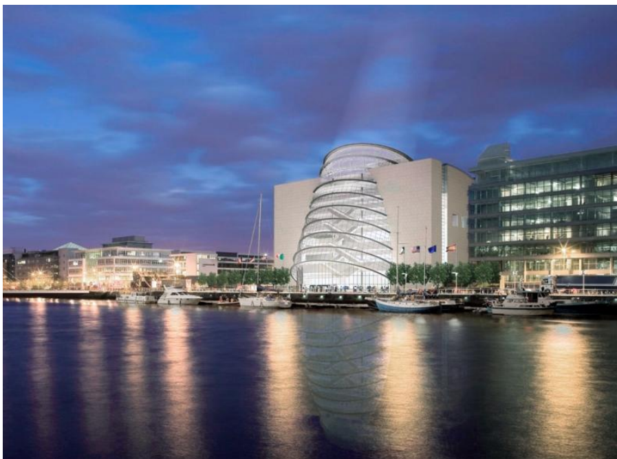
Convention centre, Dublin