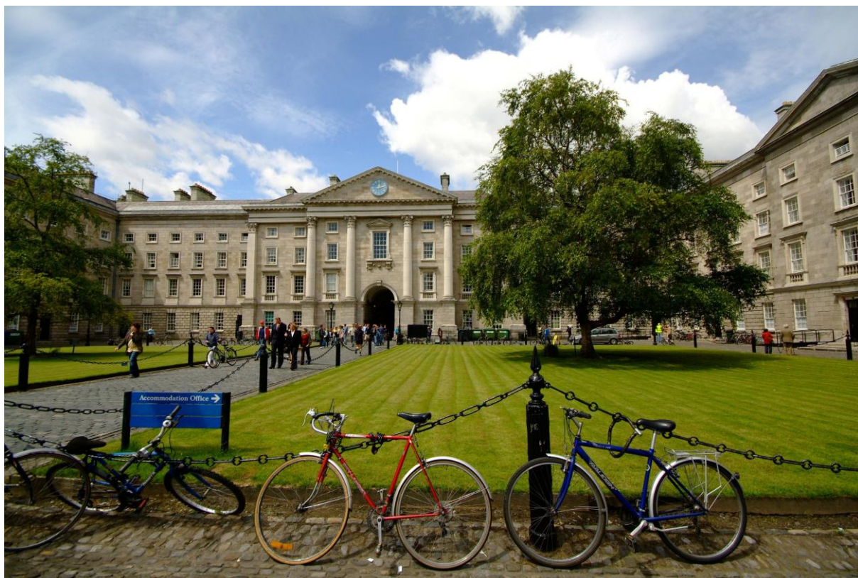
Trinity College, Dublin

Urbactova poletna univerza za lokalne podporne skupine je edinstvena izobraževalna izkušnja, prvenstveno namenjena krepitvi individualnih spretnosti in sposobnosti za razvijanje participativnega akcijskega načrtovanja urbanih politik. Na njej se bodo srečali urbani strokovnjaki, oblikovalci politik, predstavniki nevladnih organizacij, civilne družbe in zasebnega sektorja ter doživeli kombinacijo izobraževanja, usvajanja praktičnih znanj in mreženja.